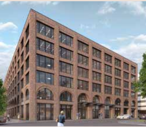
MB - work & create . München