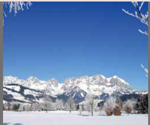
Kaisersuiten . Kirzsbühel

Herausgeber Nymphenburger Beteiligungs AG Nymphenburger Straße 4, 80335 München Tel. 089-552 50 30, Fax: 089-550 26 56 info@optima-firmengruppe.de