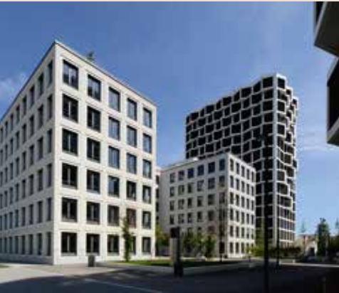
Vital Office @ Hirschgarten . München