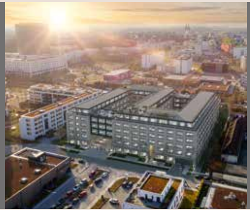
south Horizon . München