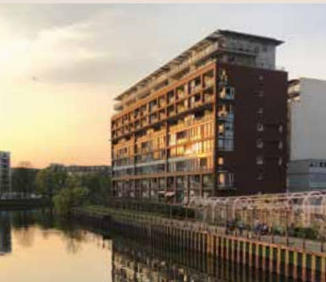
Spreeresidenz . Berlin