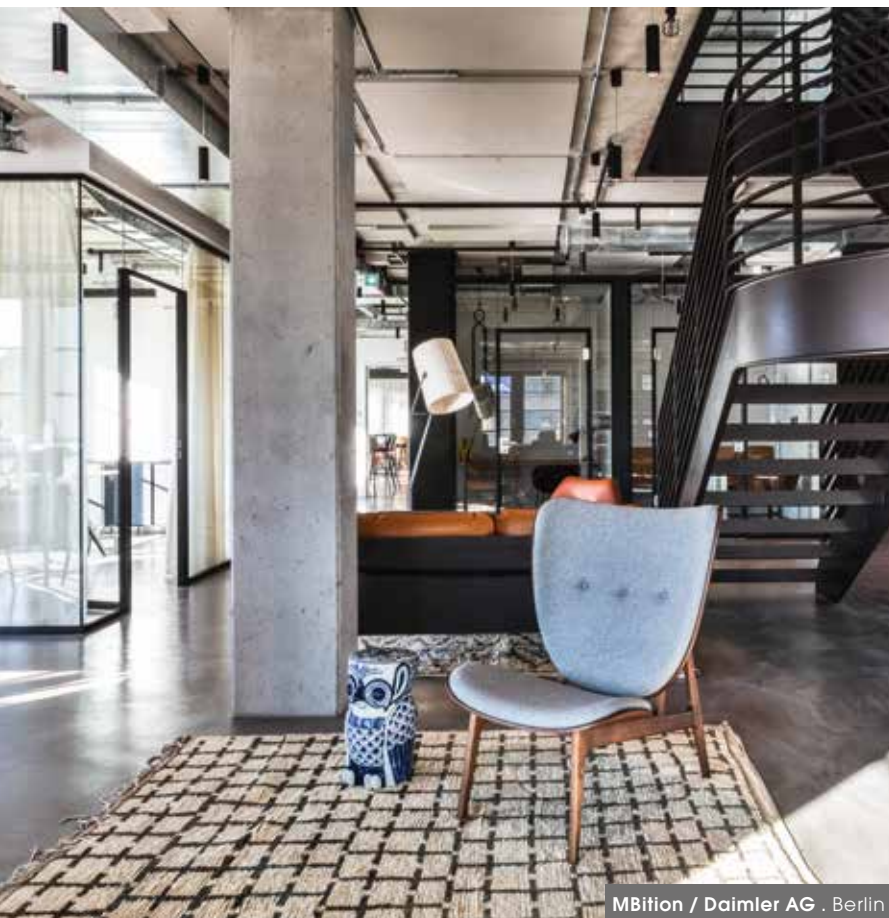
MBition / Daimler AG . Berlin

AEW AMUNDI BLACKSTONE BNP PARIBAS GENERALI LASALLE INVESTMENT MORGAN STANLEY REALIS SOCIÉTÉ GÉNÉRALE TAEKKER GROUP ZAPHIR GROUP