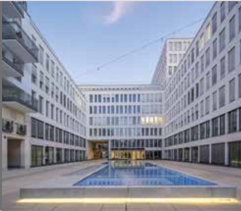
Nymphenburger Höfe . München