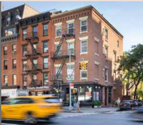
New York 242 Tenth Avenue . New York