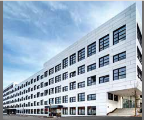
Atelier an der Medienbrücke . München