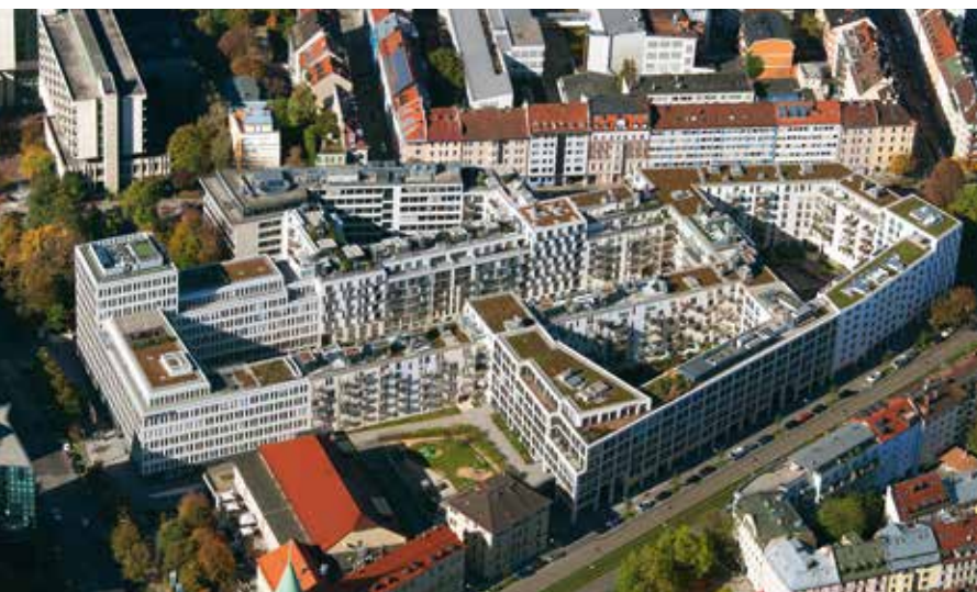
Nymphenburger Höfe . München

ADESSO · ALDI · BRAINLOOP BUNDESBANK · BEATE UHSE · CMS DAIMLER AG · DEAN & DAVID · EDEKA FLIXBUS · GRUNER & JAHR · HARK IQUOS · JUNIPER NETWORKS · KIK LANDESHAUPTSTADT MÜNCHEN LANDRATSAMT · MAN · MC FIT OLDENBOURG VERLAG PRO7 / JOCHEN SCHWEIZER REGUS · REWE · ROTES KREUZ SPRINGER VERLAG · TERADATA THINK PROJECT · UNICREDIT / MOBILITY WTS · U.V.M.