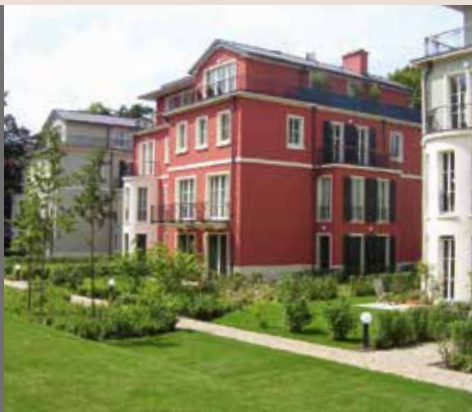
Humboldt Palais . Berlin