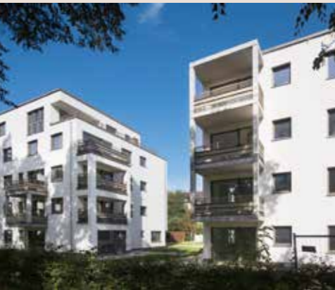
INBALANCE . München