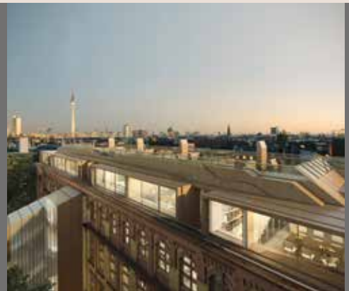
Opernlofts . Berlin