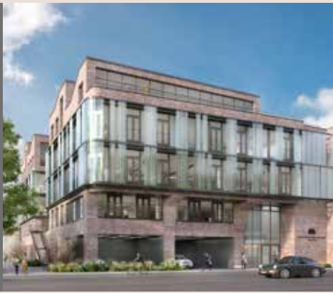
New Eastside . München