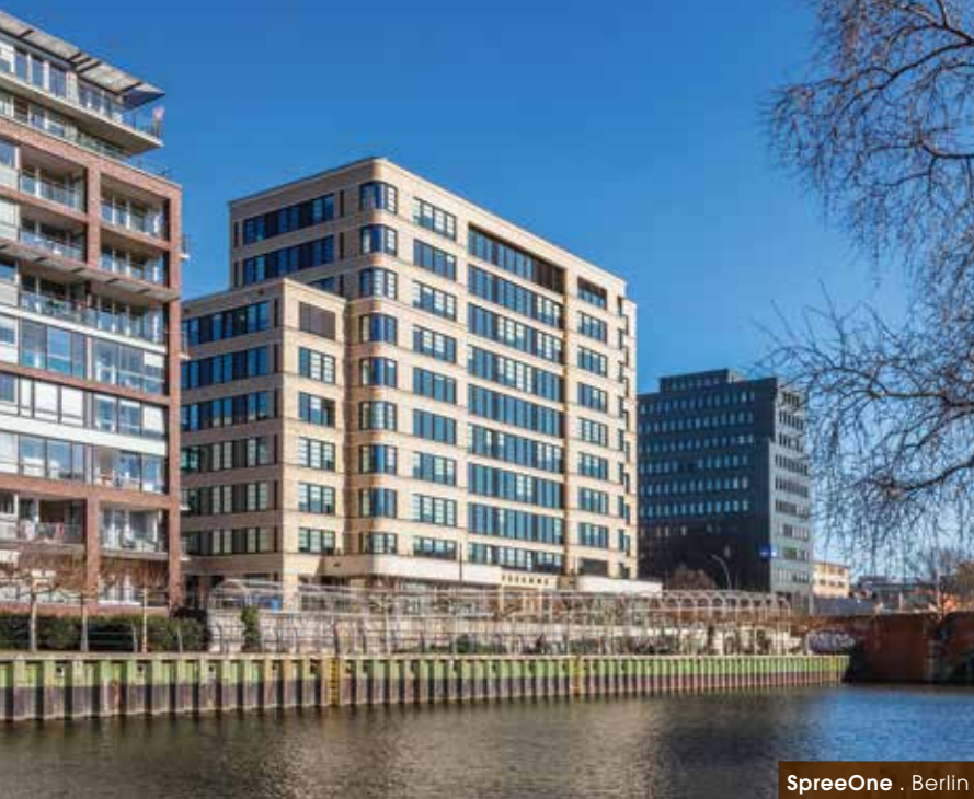
SpreeOne . Berlin