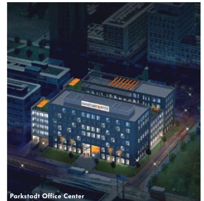
Parkstadt Office Center

Das Areal, das mit der Projektgesellschaft Parkstadt Office Center GmbH & Co. KG verbrieft wurde, konnte durch das Architekturbüro Scheller innerhalb von 6 Wochen neu beplant werden und geht noch im Dezember 2006 in Bau. Auf 13.000 qm BGF entstehen hochmoderne Büros vis-à-vis der Highlight Business Towers in direkter Nachbarschaft von Roland Berger, Fujitsu Siemens, dem Langenscheidt Verlag und General Electric. „Be Orange“ steht im Parkstadt Office Center als Synonym für ein neues Farb- und Gestaltungskonzept, das sich durch die gesamte Gebäudestruktur ziehen wird. Das Ensemble konnte innerhalb weniger Wochen bereits wieder an LaSalle Investment ( www.lasalle.com ) – einem der großen amerikanischen Immobilienfonds – veräußert werden. Als Finanzierungspartner wurde die Eurohypo AG gewonnen. Die Fertigstellung ist für das Jahr 2008 vorgesehen. Das gesamte Investitionsvolumen liegt um die 30 Mio. Neben der Optima Firmengruppe baut derzeit noch die IVG/Frankonia auf einem Areal neben dem IDG Verlag eine Bürokomplex. Die Parkstadt Schwabing entwickelt sich somit zu einem der führenden Bürostandorte Münchens und wird dem Titel als so genannte „Neue Münchener Adresse“ mehr als gerecht werden.