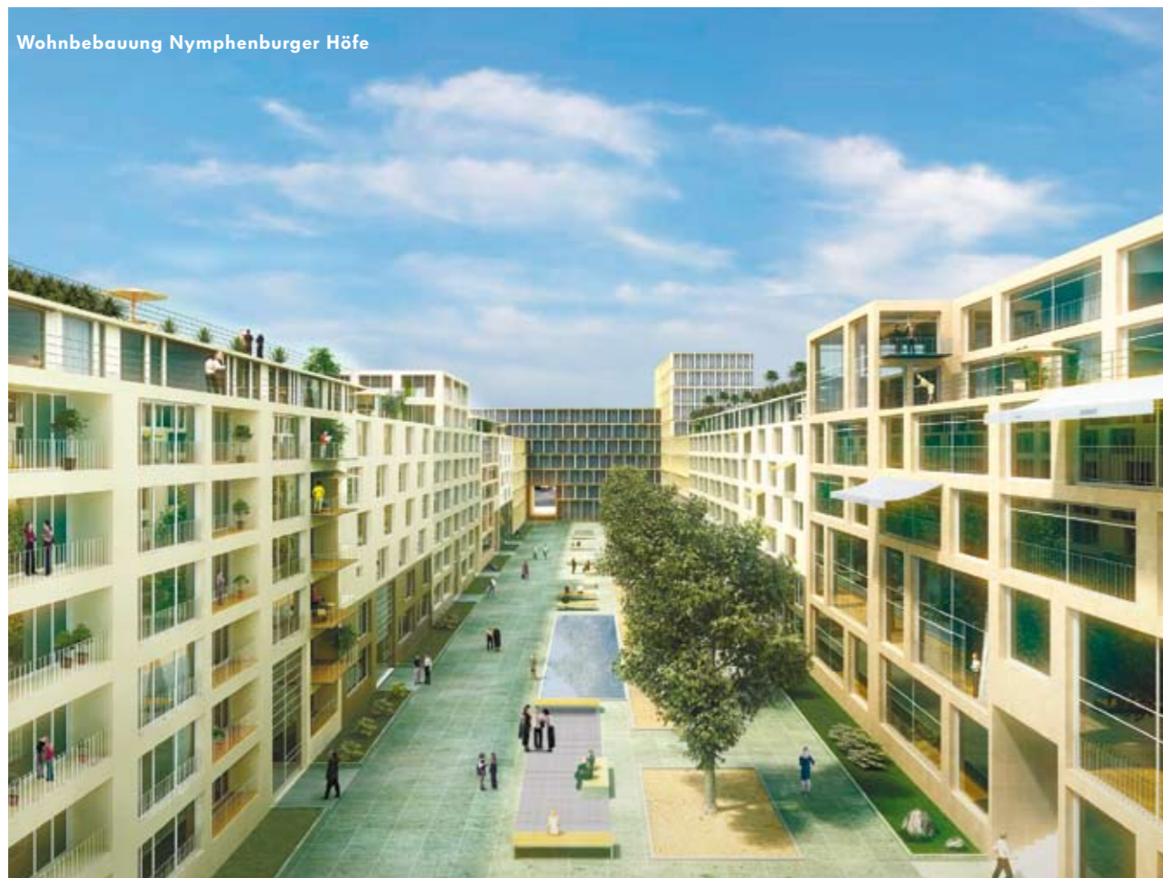
Wohnbebauung Nymphenburger Höfe

Selten wurden in der bayerischen Landeshauptstadt so viele neue Projekte innerhalb der Stadtmauern initiiert und realisiert wie in den vergangenen zwei Jahren. Nymphenburg Süd, der Hirschgarten, das alte Löwenbräuareal, der Ackermannbogen, die Parkstadt Schwabing oder der Arnulfpark sind nur einige Adressen, die überwiegend im Münchener Westen in Zukunft für ein neues und attraktives Wohnraum- und Büroangebot sorgen werden.