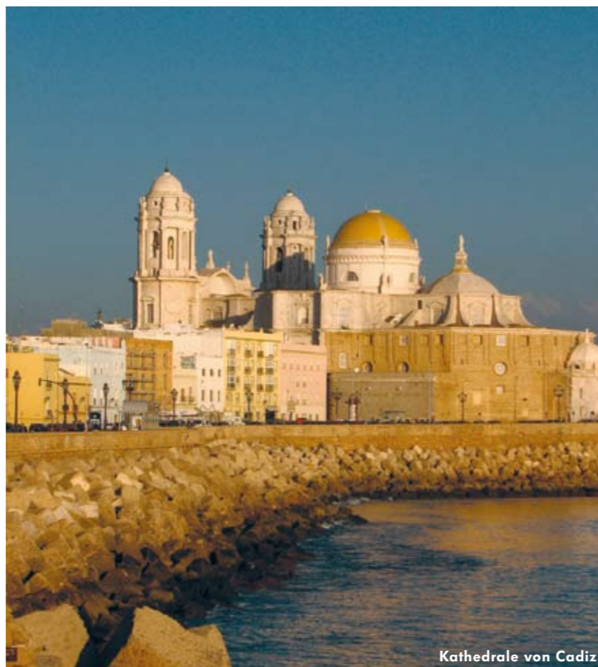
Kathedrale von Cadiz