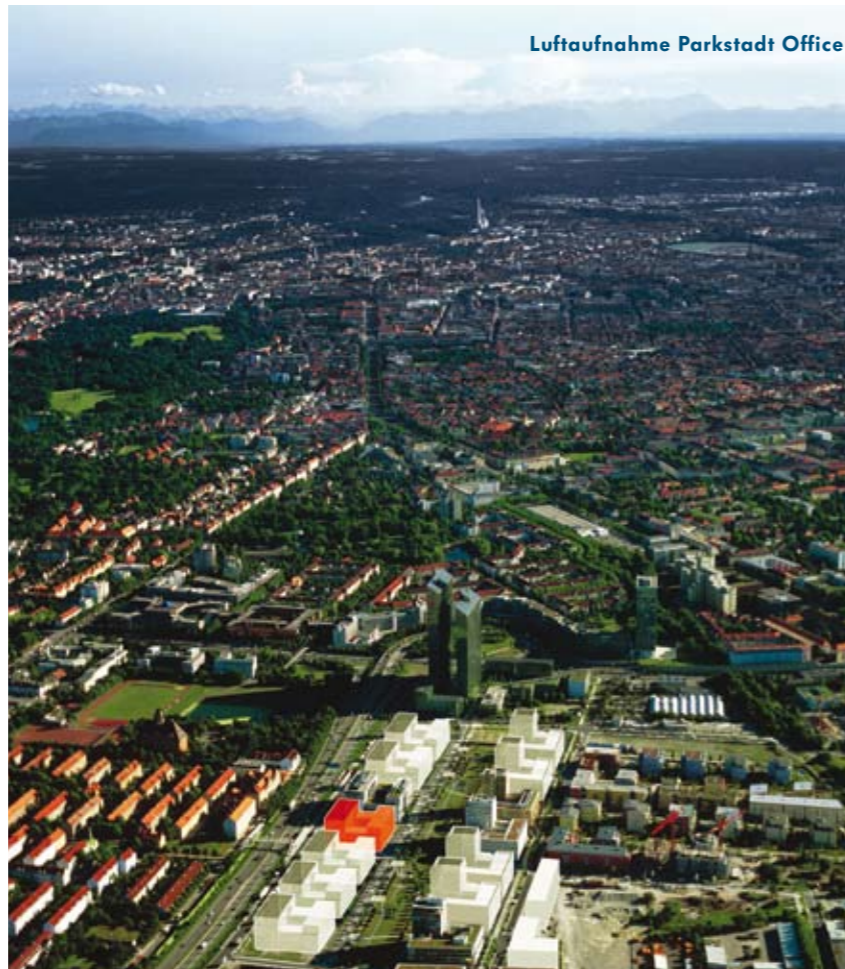
Luftaufnahme Parkstadt Office

Während letztes Jahr noch der Katzenjammer um die drei Hochhäuser Highlight Towers in der Parkstadt Schwabing, Uptown Munich am Georg-Brauchle-Ring und Munich City Tower an der Donnersberger Brücke groß war, sind die Türme zwischenzeitlich weitgehend vermietet. Für die größte Furore sorgte die Anmietung durch O2 (Makler: Schauer & Schöll) im Hines Tower mit knapp 50.000 qm. Fast bedeutender ist jedoch die Zwischenvermietung an der Donnersberger Brücke an MAN (Makler: Atis Real), der Bezug der Highlight Business Towers in der Parkstadt Schwabing durch Fujitsu Sie-