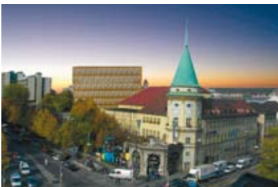
Das Löwenbräuareal am Münchener Stiegelmeierplatz

Gekauft wurde das rund 3 ha große Areal von der Optima gemeinsam mit dem irischen Familienunternehmen Embassy Group und der IKR Bauträger GmbH.