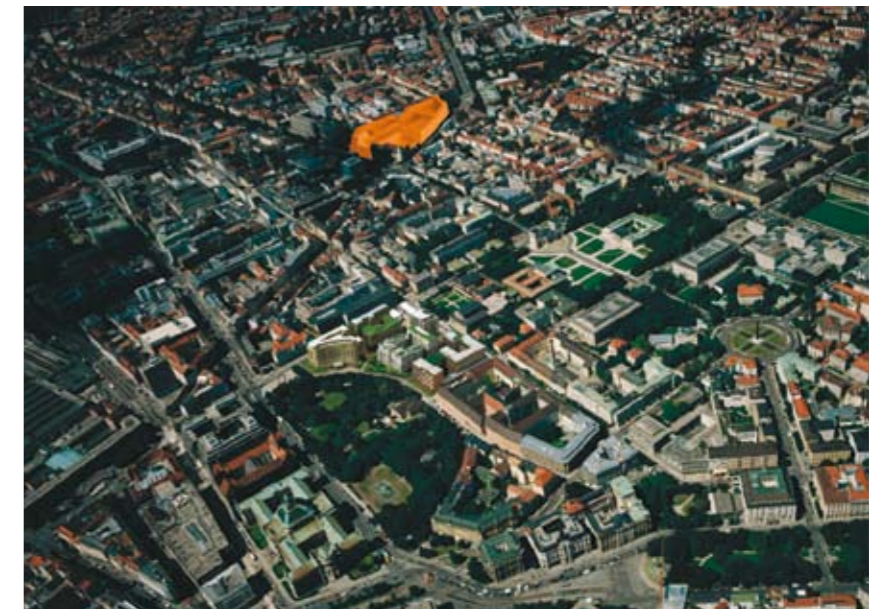
Luftaufnahme Nymphenburger Höfe

Die Maßnahmen der Vivico und der Aurelis auf ehemaligen Bahnbrachen sind ein städtebaupolitisches Meisterstück, wenn man bedenkt, wie lange hier Gebrauchtwagenhändler Bestflä-