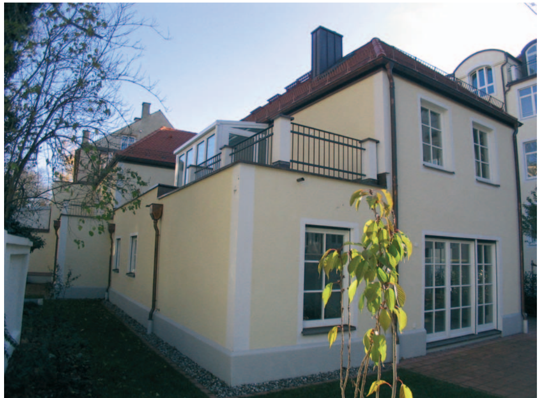
Wohnen und Arbeiten in der Lindwurmstraße – der Innenausbau erfolgt nach Mieterwünschen. Denkmalgeschützte Jugendstilvilla in der Bothmerstraße wurde saniert und im Geiste zeitgemäßen Wohnsprints umgebaut. Im rückwärtigen Bereich ergänzt ein Neubautrakt mit weiteren Wohnungen den Bestand