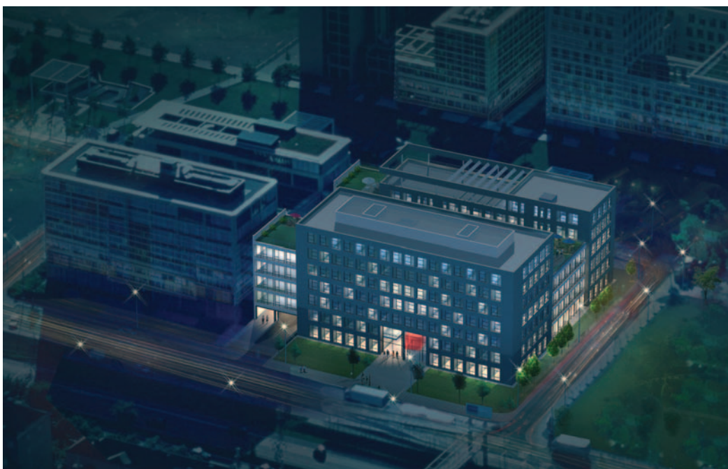
Parkstadt Office Center Munich – auf 13.000 m 2 werden ab 2008 neue Arbeitsplätze in der Parkstadt Schwabing entstehen. Die Optima-Aegidius Firmengruppe entwickelt gemeinsam mit der IKR Bauträger GmbH den neuen Bürokomplex auf dem ehemaligen Skanska areal. Das Investitionsvolumen beträgt rund 30 Mio. Euro

In ein ehemaliges Verwaltungsgebäude zwischen Herzog-Wilhelm-Straße und Sonnenstraße, das bis 2004 im Besitz der Barmer Ersatzkasse war, investiert die OPTIMA Nymphenburger Beteiligungs AG rund 10 Mio. Euro. Zwischen 2005 und 2006 wurde das Ensemble aus den 50er Jahren im Retrodesign revitalisiert, so dass heute auf 4.000 m 2 flexible City Offices nach modernsten Ansprüchen mit 14 Stellplätzen dem Münchner Büromarkt zur Verfügung stehen. Die zentrale Lage am Sendlinger Tor ist nur ein Charakteristikum des sechsgeschossigen Gebäudes. Offene Grundrisse mit weitgehender Stützenfreiheit tragen zum Loftfeeling der flexibel nutzbaren Büroflächen bei. Im Innenausbau kommen Designerobjekte von Philippe Starck und Duravit Architec zum Einsatz. Durchweg hochwertige Oberflächenbeläge prägen das Erscheinungsbild der Innenräume und Glastrennwände dienen wahlweise als transparente, kommunikative Raumunterteilung. Im repräsentativen Foyer inspirieren moderne Stil- und Designmittel die Mitarbeiter und Besucher mit Videoanimationen und Holzskulpturen. Seminar- und Konferenzräume stehen im Erdgeschoss allen Mietern gleichermaßen zur Verfügung. Ein