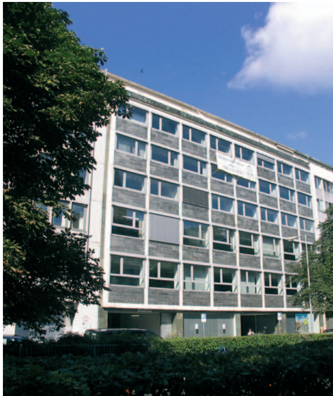
Charme der 50er Jahre zu neuem Leben erweckt: Nach der Revitalisierung eines ehemaligen Verwaltungsgebäudes an der Herzog Wilhelm Straße locken loftartig konzipierte Büroetagen mit hochwertig gestaltetem Innenausbau

Von der exponierten Dachterrasse mit 116 m 2 genießt man den